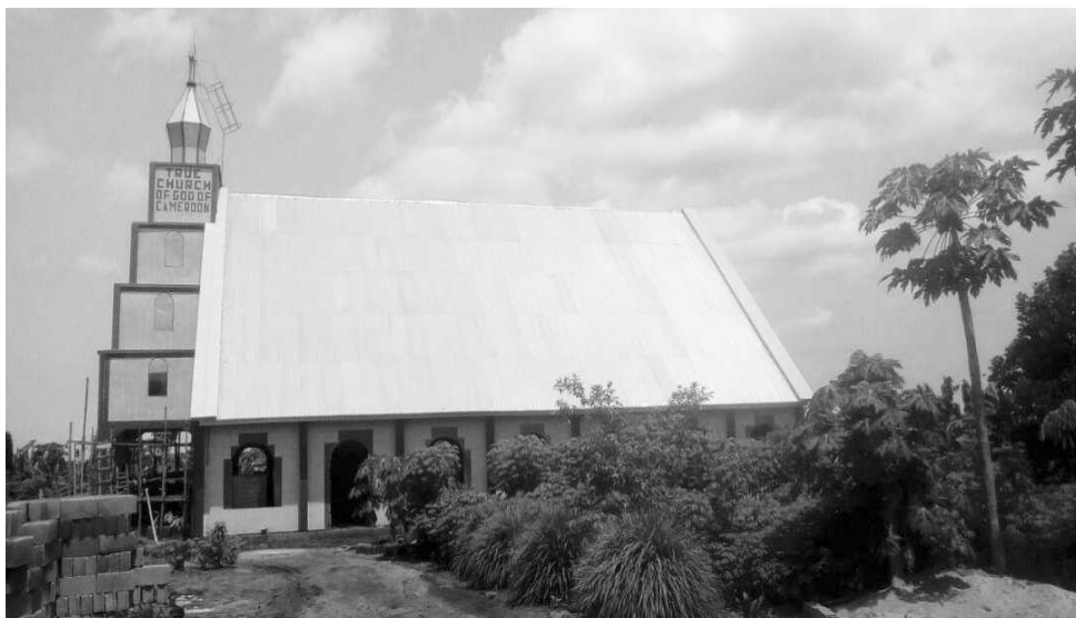
Une vue extérieure de l'Assemblée

Le serviteur est le frère Ngami Joseph. Il répond au numéro (WhatsApp aussi) 6 75 04 91 75.