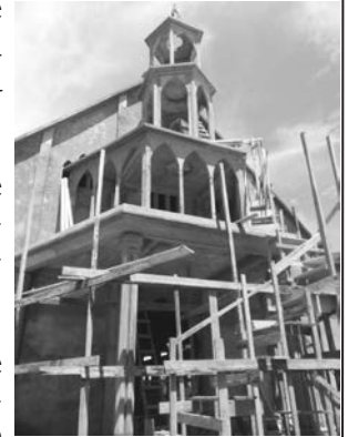
Une vue du portique de Batouri

3. Travaux de construction d'aménagement du camp de Tiko en cours.