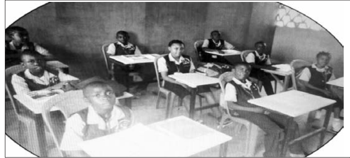
Des élèves dans un sale de classe

Aux parents : construire un lien particulier avec les autres partenaires de l'éducation (enseignants surveillants censeur ...) afin d'assurer un suivi rapproché.