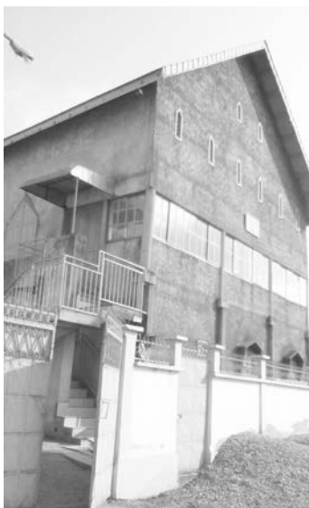
Une vue extérieur de l'Assemblée

Pour les besoins de ce mois, la rubrique découverte a posé ses valises dans une autre assemblée de la ville de Yaoundé situé dans l'arrondissement de Yaoundé 4, non loin de la légendaire prison centrale de Yaoundé, à savoir l'assemblée de KODENGUI. En remontant l'histoire, nous avons pu découvrir que cette assemblée avait fait ses premiers pas en 1992 dans une cellule de prière en planche, située dans les bas-fonds du quartier KODENGUI. Deux ans plus tard, la dite cellule de prière fut érigée en assemblée toujours dans le même lieu. En 1994, l'ancien JOSEPH INGWAT 2 met à la disposition de l'Eglise une locale plus représentatif dans sa demeure de KODENGUI, pour abriter l'assemblée, encadrée par l'aspirant WIZEMBE VICTORIEN, assisté des Pasteurs LONGUE Samuel, ATEBA Jean Marie et BEKADA Marius. Ce local sera occupé par