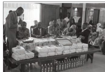
Les Membres du jury