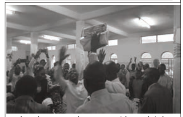
Les jeunes qui savourent leur victoire