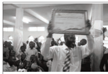
Le DP de la RJ2r brandissant le Diplôme des Vainqueurs