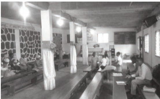
Une vue intérieur de l'Assemblée