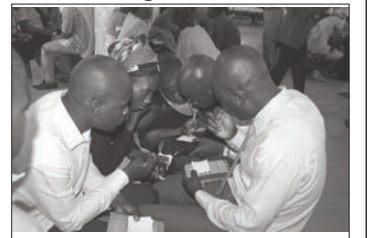
Une attitude des vainqueurs