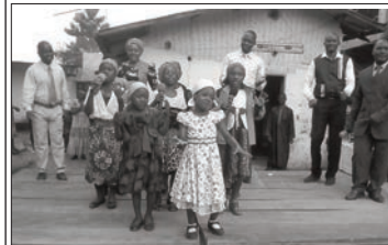
Une vue des Activités Culturelles