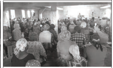
Une vue de la Conférence Biblique